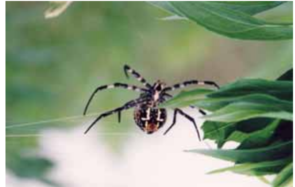
五色池ではコガネグモが迎えてくれます