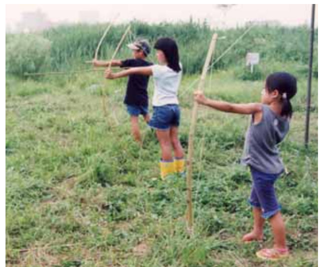
弓矢は女の子にも大人気！