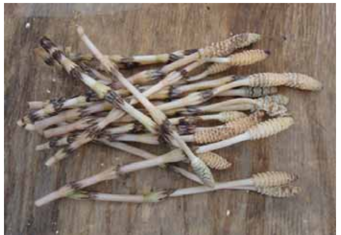
3月17日の活動日にとったツクシでおいしくいただきました。