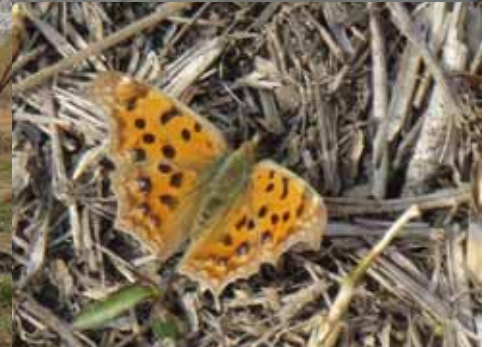
春の使者アカタテハが五色池に