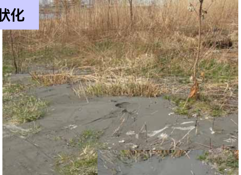
液状化で噴出した細かい砂

次回4月17日の『野草を探して食べてみよう』の企画にむけて、野草などを詳しく調べました。